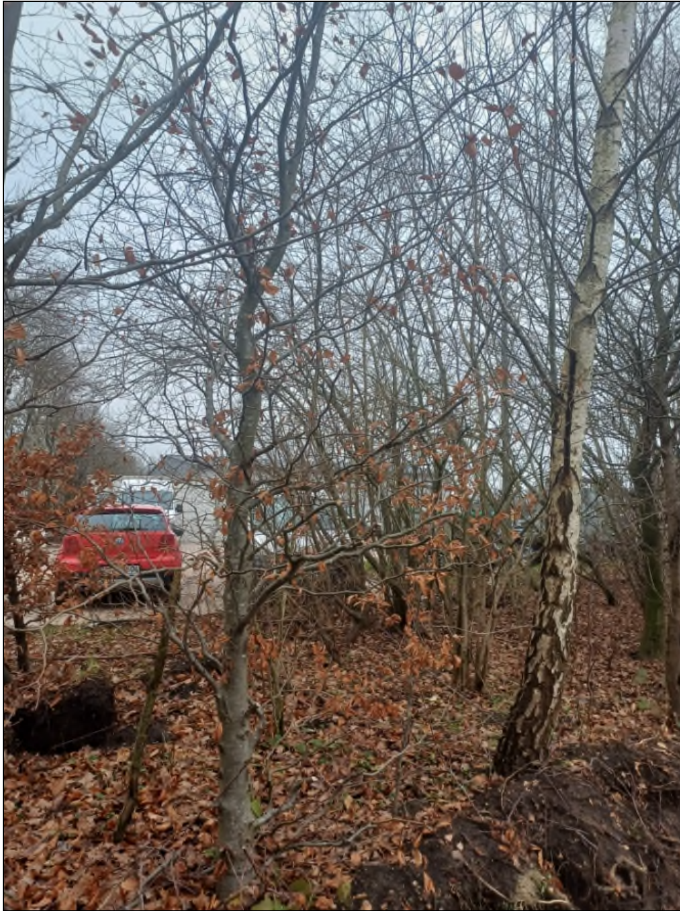
Abb. 3: Detailansicht der betroffenen Hecke.