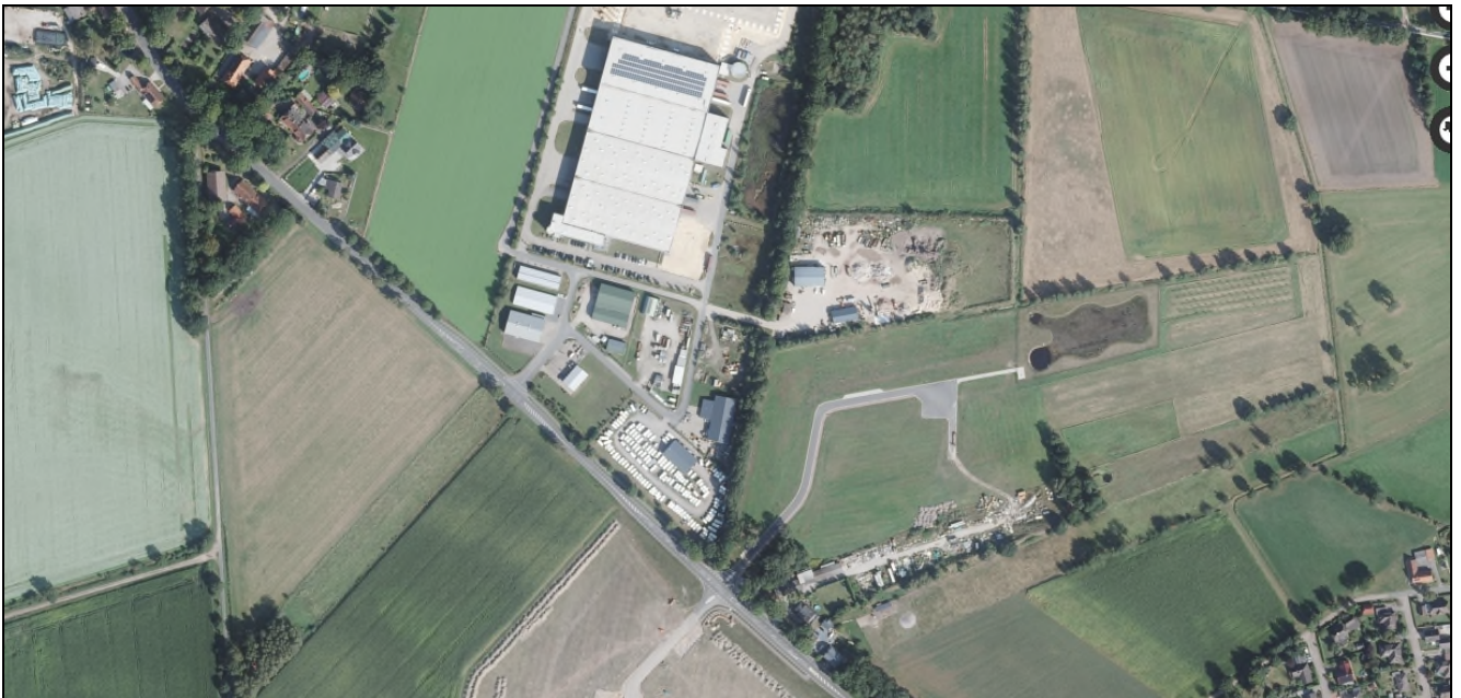
Abb. 4: Habitatstruktur im Umfeld der Hecke.

Es ist zusammenfassend festzustellen, dass die artenschutzrechtlichen Zugriffsverbote nicht einschlägig sind, wenn die vorstehend beschriebene zeitliche Beschränkung der Gehölbeseitigung eingehalten wird.