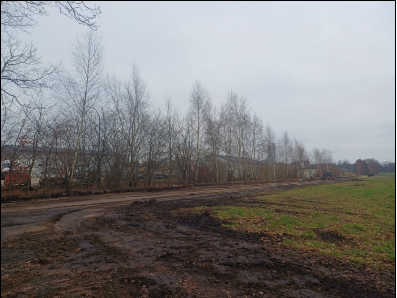
Abb. 2: Ansicht der betroffenen Hecke am Rande der bestehenden Gewerbeflächen.

Von der Rodung betroffen ist eine Strauch-Baumhecke (HFM), die aus Sträuchern, jungen Bäumen und Birken mit maximal 10 bis 20 cm Brusthöhendurchmesser besteht (Abb. 2 und 3). Aufgrund der geringen Dimensionierung der Bäume ist ein Vorkommen von Höhlen oder tieferen Spalten ausgeschlossen, so dass die Hecke keine Funktion als Fledermausquartier oder als Brutplatz höhlenbrütender Vogelarten haben kann. Auch Horstbäume sind nicht vorhanden. Auch kommen kein stärker dimensioniertes Totholz oder Mulmhöhlen vor, so dass Habitate für europäisch geschützte Alt- und Totholzkäferarten nicht vorhanden sind.